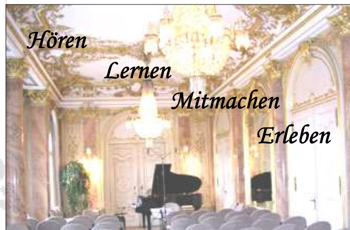
Beim Konzert im barocken Spiegelssaal des Rathauses Bergedorf mitspielen