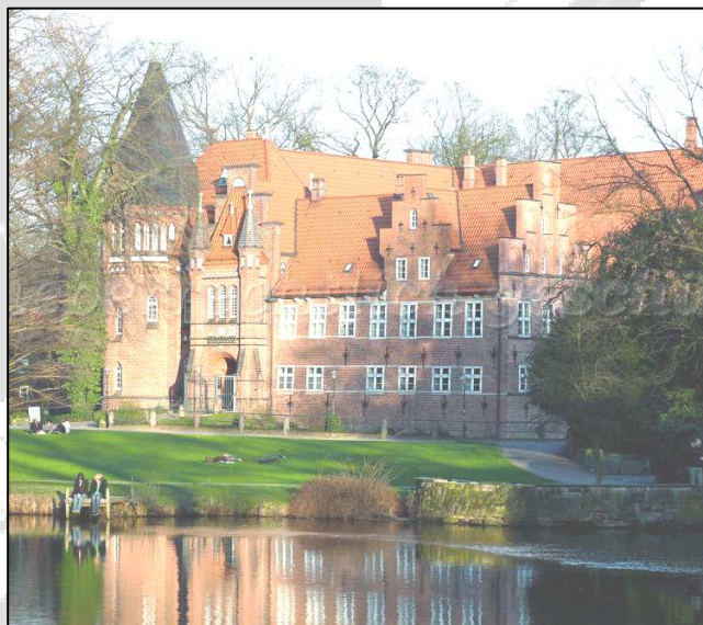
... hier finden unsere Treffen und Mahlzeiten statt.

Dieser Kammermusik-Kurs für Jugendliche wird möglich durch zahlreiche freiwillige Helfer und die freundliche Unterstützung von: